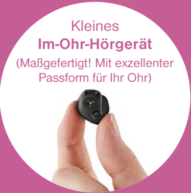
Kleines Im-Ohr-Hörgerät (Maßgefertigt! Mit exzellenter Passform für Ihr Ohr)