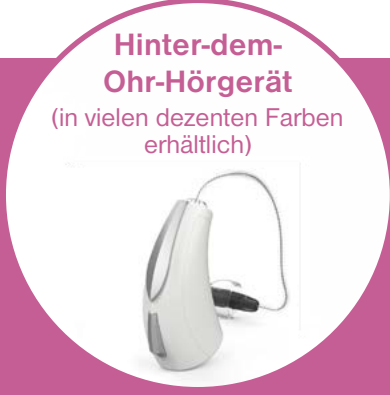
Hinter-dem-Ohr-Hörgerät (in vielen dezenten Farben erhältlich)

Akku-Ladebox: Einfaches umweltschonendes Aufladen der Hörgeräte über Nacht